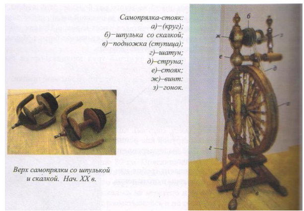
Самопрялка-стояк: а)–(круг); б)–шпулька со скалкой; в)–подножка (ступица); г)–шатун; д)–струна; е)–стояк; ж)–винт; з)–гонок.