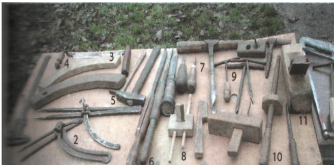
Инструменты для изготовления прялки: 1 – штангенциркуль ;3 - приметки; 4 - скобелка; 5 - молоток; 6 -резцы; 7 - трубочки; 9-буравцы; 10-винтовки; 11 -рубанок.