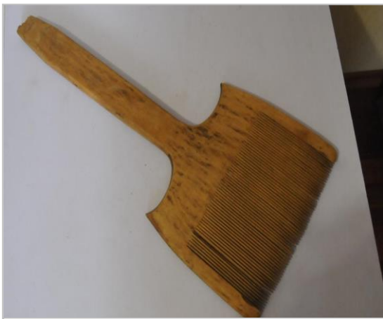
Гребень. Конец XIX-начало XX вв.