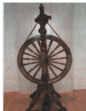
Прялка. Конец XIX в. Село Незнамово

Изготовлением прялок кустари занимались круглогодично, с перерывом на полевые работы. Дерево заранее заготавливали на целый год, чтобы оно могло высохнуть, поскольку в производстве использовался только сухой материал. Использовали ольху, березу, осину, осокорь, липу, тополь. Закупка леса проводилась чаще всего в Обуховских лесах.