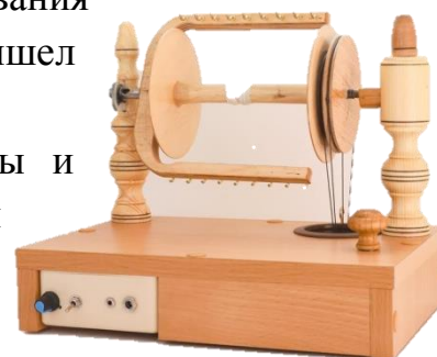
Электрическая прялка с функцией шотландского натяжения на подиуме

Современные бытовые электропрялки компактны и просты в использовании. Обладая высокой производительностью, они позволяют регулировать скорость подачи шерсти и контролировать ровность пряжи. Прялку можно использовать для ссучивания нескольких нитей в одну.