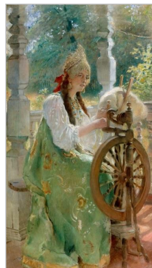
«За прялкой», К. Е. Маковский, 1900 г.

Русские слова «время» и «веретено» происходят от одного древнего глагола со значением «вращаться по кругу». Из женских ремесел в наш язык вошли